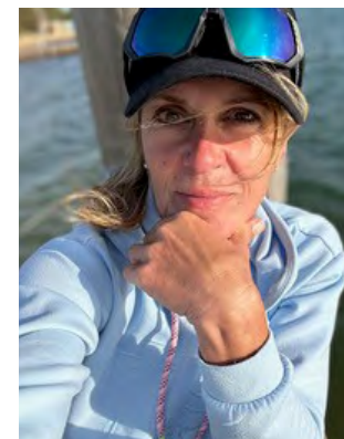
HANKA KUPFERNAGEL Radsportlerin, 8-fache Welt- meisterin, 35-fache deutsche Meisterin in verschiedenen Disziplinen, Unternehmerin, Kommentatorin